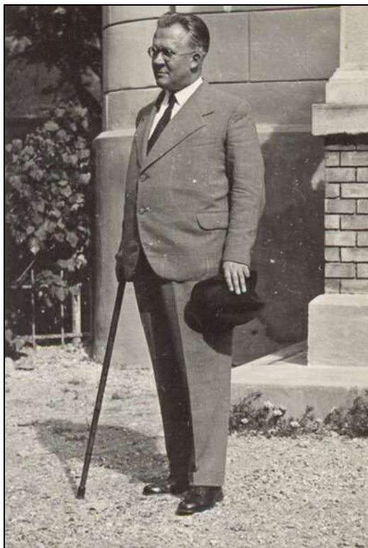
Kolozsváron készült, valószínűleg a Protestáns Teológiai Intézet udvarán