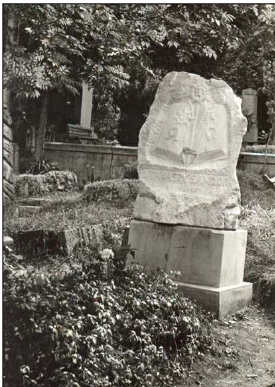
A sír a kolozsvári Házsongárd-temetőben; nyitott könyvet szimbolizál, bal oldali kövön alfával, jobb oldali kövön omegával

A fényképeket a szerző bocsájtotta rendelkezésünkre. [Mikes International Szerk.]