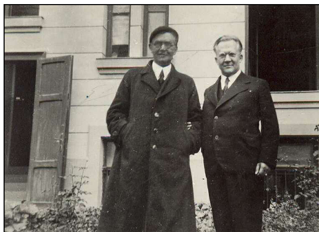
Karl Barth kolozsvári látogatása alkalmával készült, szintén a Protestáns Teológiai Intézet udvarán