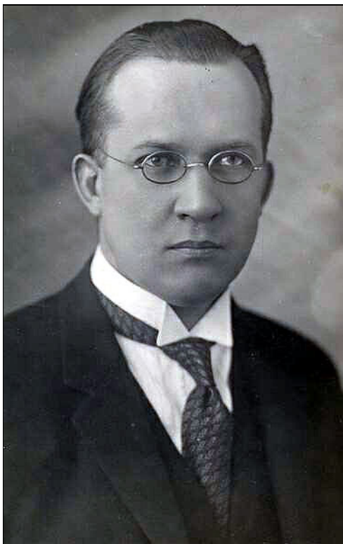
Fiatalkori kép, Jénában készült (Tavaszy ott hallgatott néhány szemesztert)