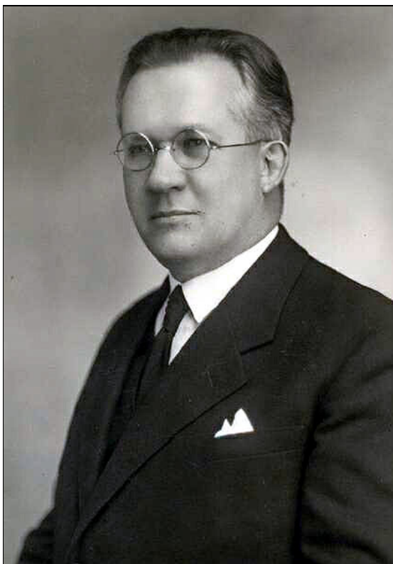
Kolozsváron készülhetett, minden bizonnyal egy tabló-fotó