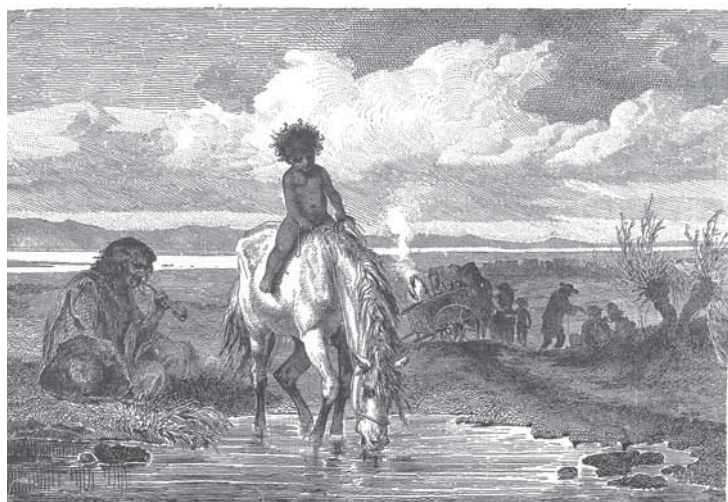
CZIGÁNY-KARAVÁN. (Sáveg a 11. lapom.)

A mai cigány vizuális önképben a ló még hangsúlyosabban betölti a szabadság, a szabad vándorlás szimbólumának szerepét, mint a