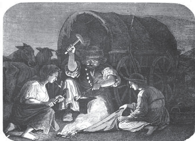
Vándor cigány család.