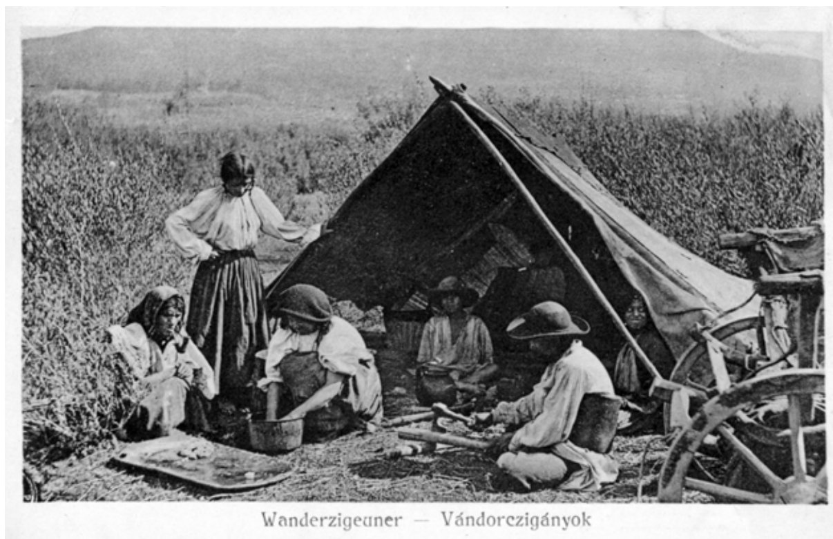
Wanderzigeuner — Vándorcigányok