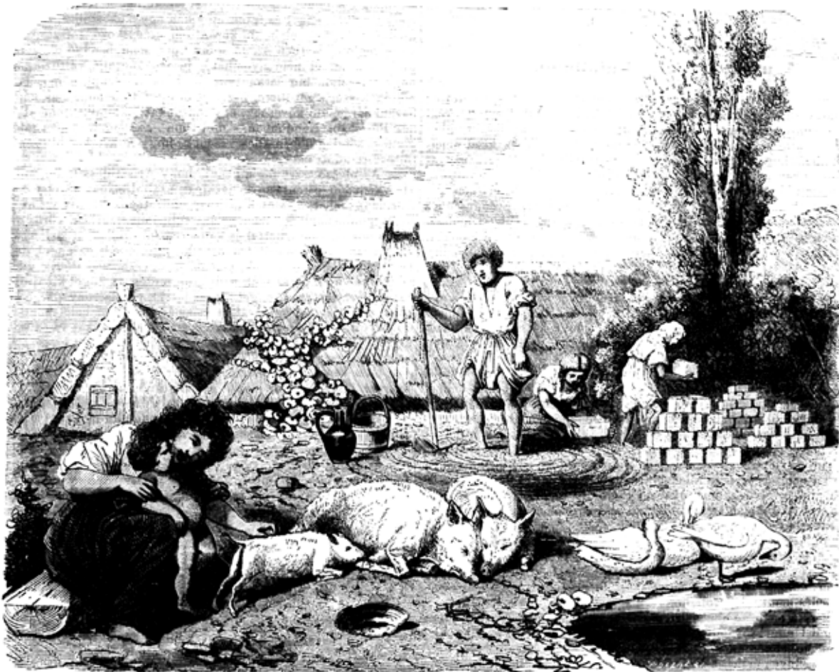
Képek a hazai népeletről: XXVI. Vályogvető-cigányok. — Ujházy F. vázlata után Jankó J.