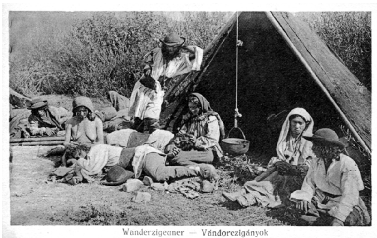
Wanderzigeuner — Vándorcigányok