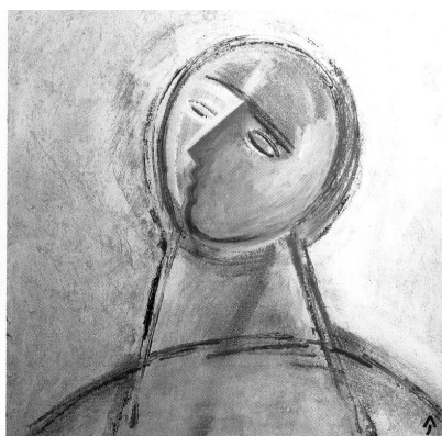
Aknay János: Órangyal; Egyedül