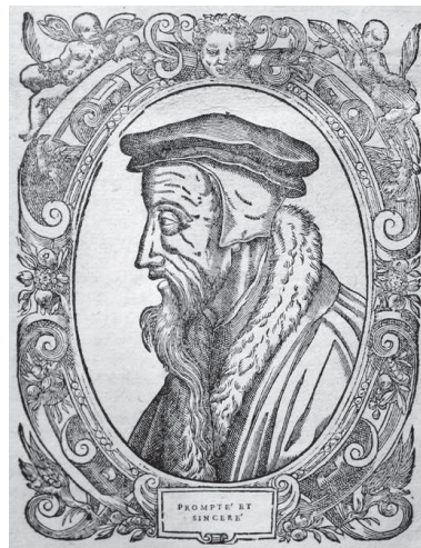
Pierre Cruche: Kálvin profilportréja, 1580

Beze, Théodore de: Vrais pourtraits des hommes illustres , 1581.