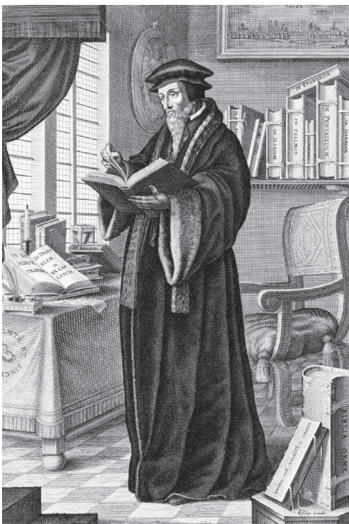
G. T. Visscher: Kálvin dolgozószobájában, 1658 előtt

75. G. T. Visscher: Kálvin dolgozószobájában.