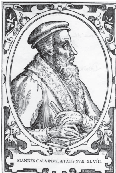
Kálvin profilportréja 48 éves korában. 1574 vagy kicsit később

Evangelii zu diesen unsern letzten zeiten an tag hat kommen lassen , Dresden 1588.