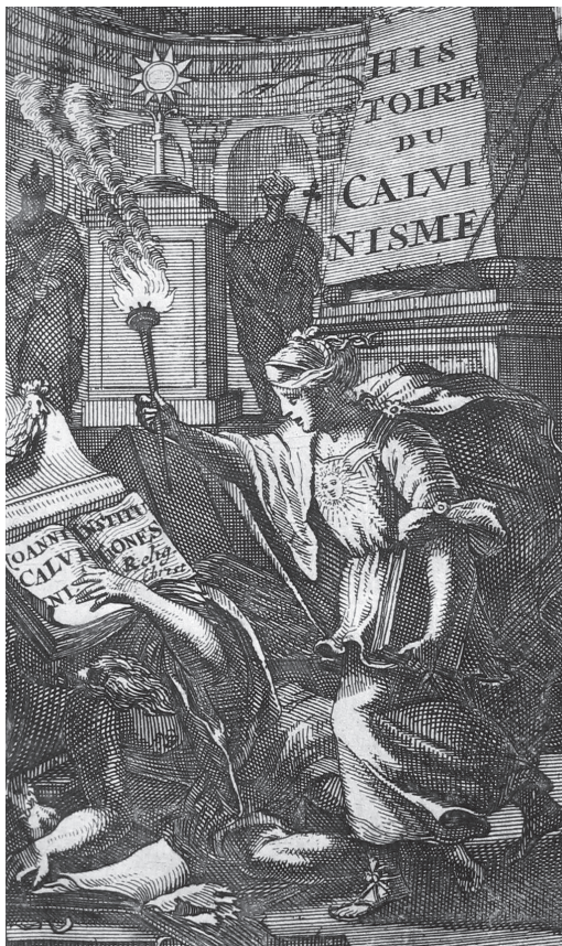
Kuporgó Kálvin, 1682

DOUMERGUE, 1909. 178, pl. XXV. CH vol. LXII. 37, n. 5478.