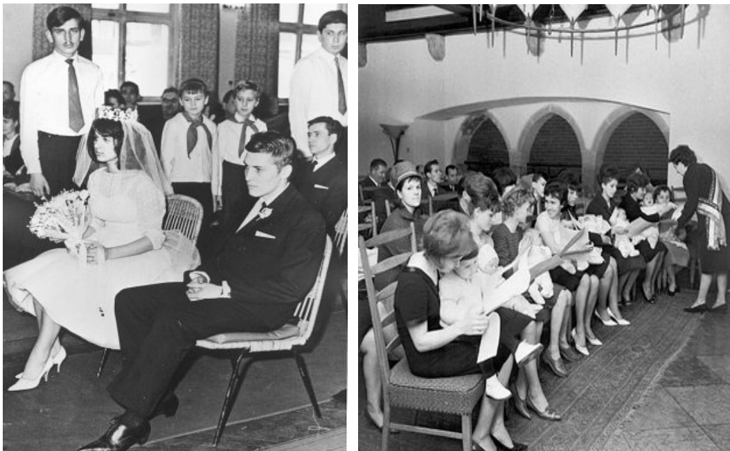
Esküvő kisdobosokkal, úttörőkkel és munkahelyi, szakszervezeti névadó

A keresztelés helyét a „névadó ünnep”, a bérmálás, illetőleg a konfirmáció helyét a „kisdobos avatás” vagy a „nagykorúsítási ünnepély” foglalta el. Számos munkahelyen évente egyszer rendeztek tömeges névadó ünnepséget, ahol gyakran a szocialista brigádok vállalták a névadó szerepét. Az állam és a párt anyagi kedvezményekkel is igyekezett megkedveltetni ezeket az egyházzellenes szándékkal propagált családi ünnepségeket. A hívők úgy oldották meg a lelkiismereti problémát, hogy a kommunista esküvő vagy keresztelő után felkerestek valahol, a lakóhelyüktől messze egy ismerős papot, aki zárt ajtók mögött megeskette az új párt vagy megkeresztelte az újszülöttet.